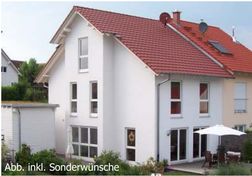
Abb. inkl. Sonderwünsche