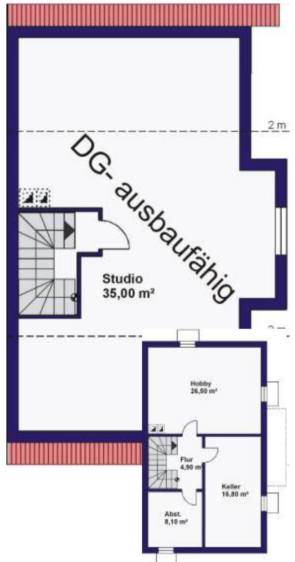
WOHNFLÄCHE EG : ca. 62,30 m 2